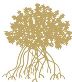
Proposition de logo parc naturel marin Martinique Pictogrammes Partie haute

Outil premier d'identification du Parc naturel marin de Martinique, son logo se devait d'être représentatif de ses valeurs et de ses champs d'action tout en étant fédérateur et porteur de sens auprès de la population. Inscrit dans la charte graphique des Parcs naturels marins, sa colorimétrie, forme et typographie étaient déjà définis. Il restait ainsi à déterminer l'ensemble des pictogrammes le composant.